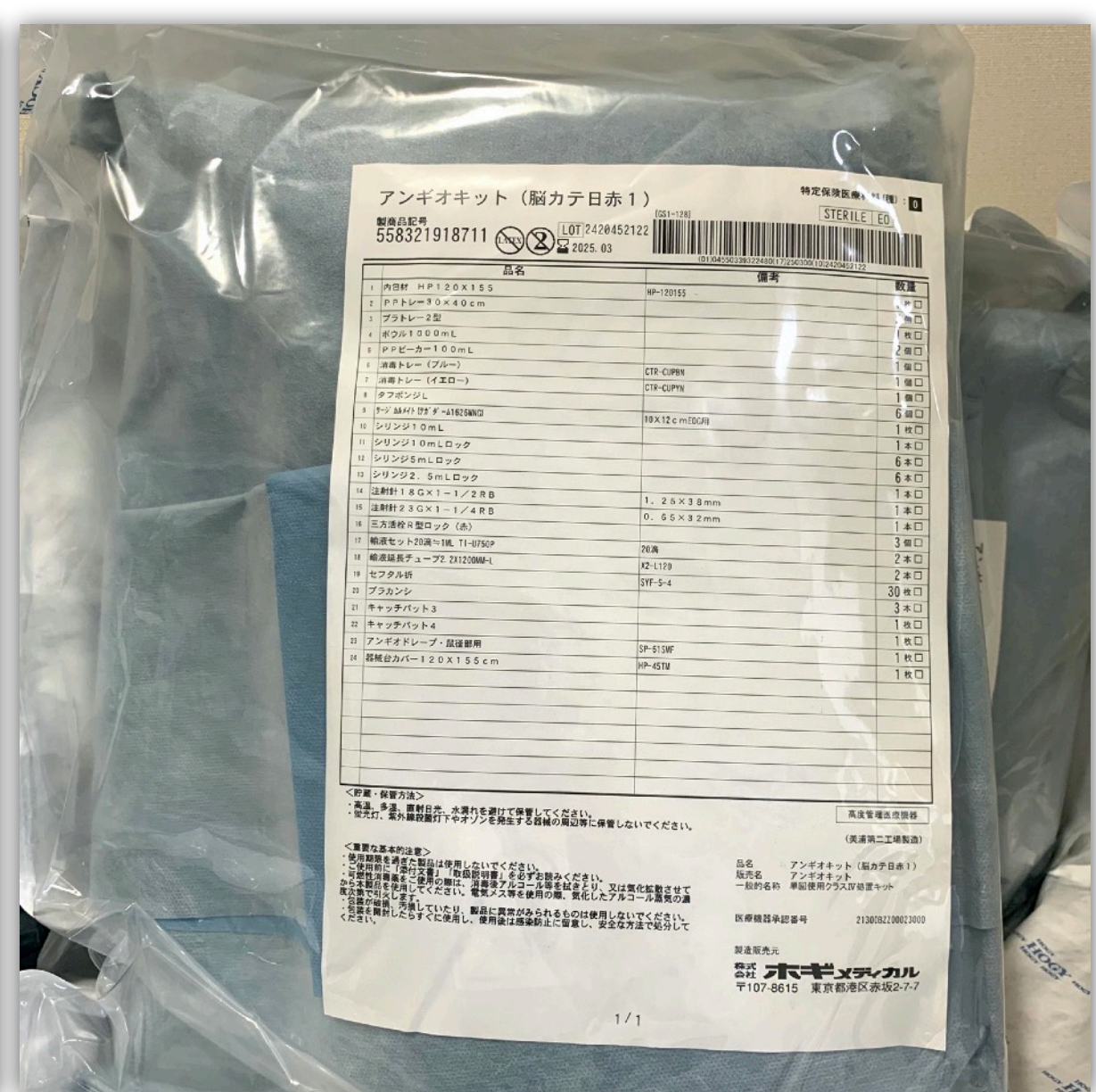
ドレープ、トレイ、シリンジなどはセット化して準備