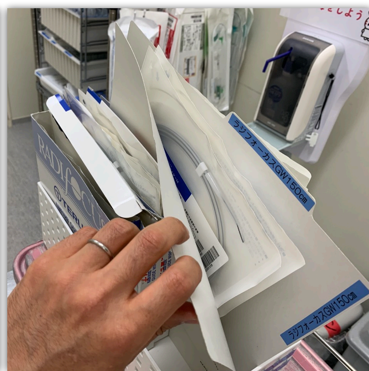
ガイドワイヤーは種類ごとに「コクヨ ファイル個別フォルダー」で整理