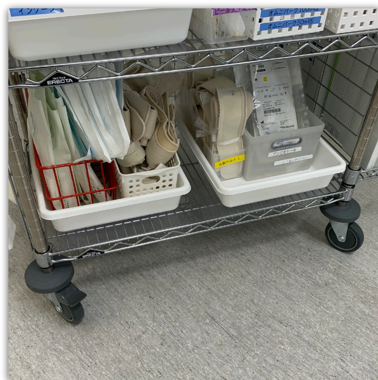
大きめのキャスターで移動も楽に