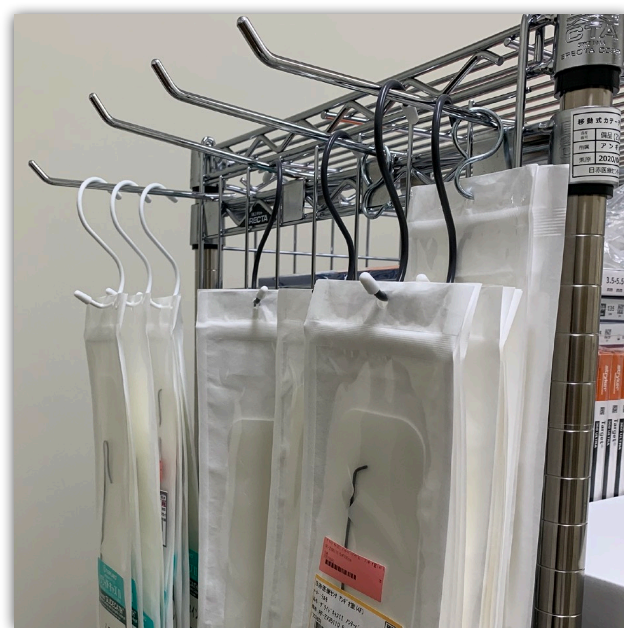
カテーテル種類ごとにS字フックで分別