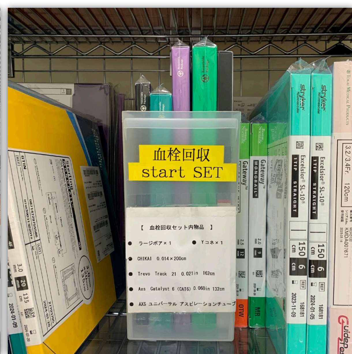
血栓回収用緊急セット