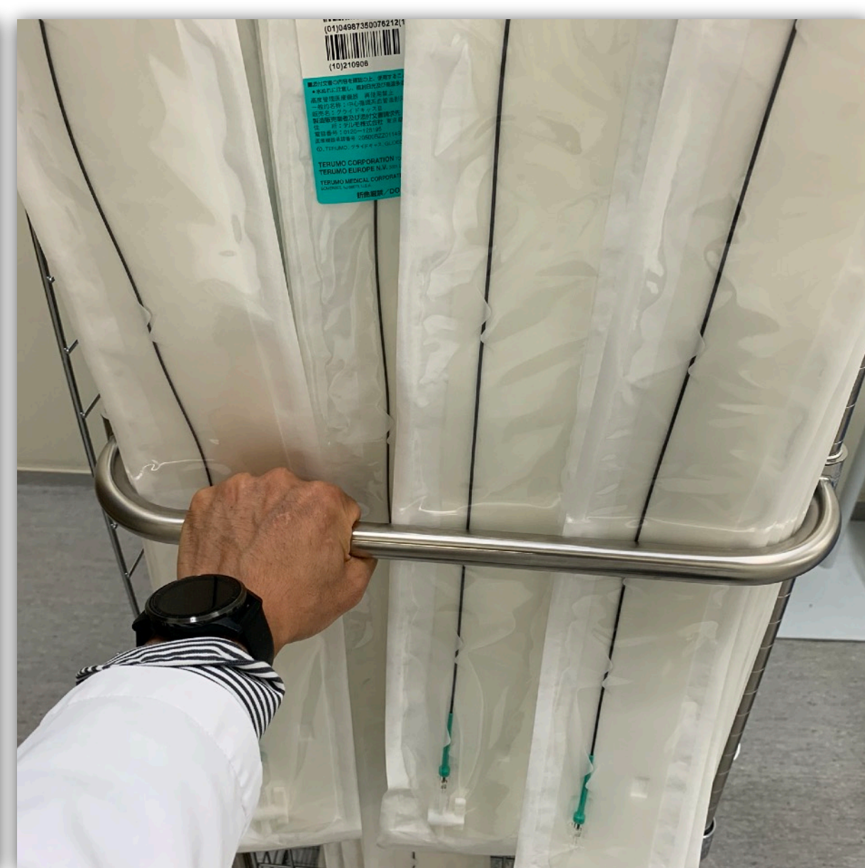
ハンドルはカテーテル保持の役割も