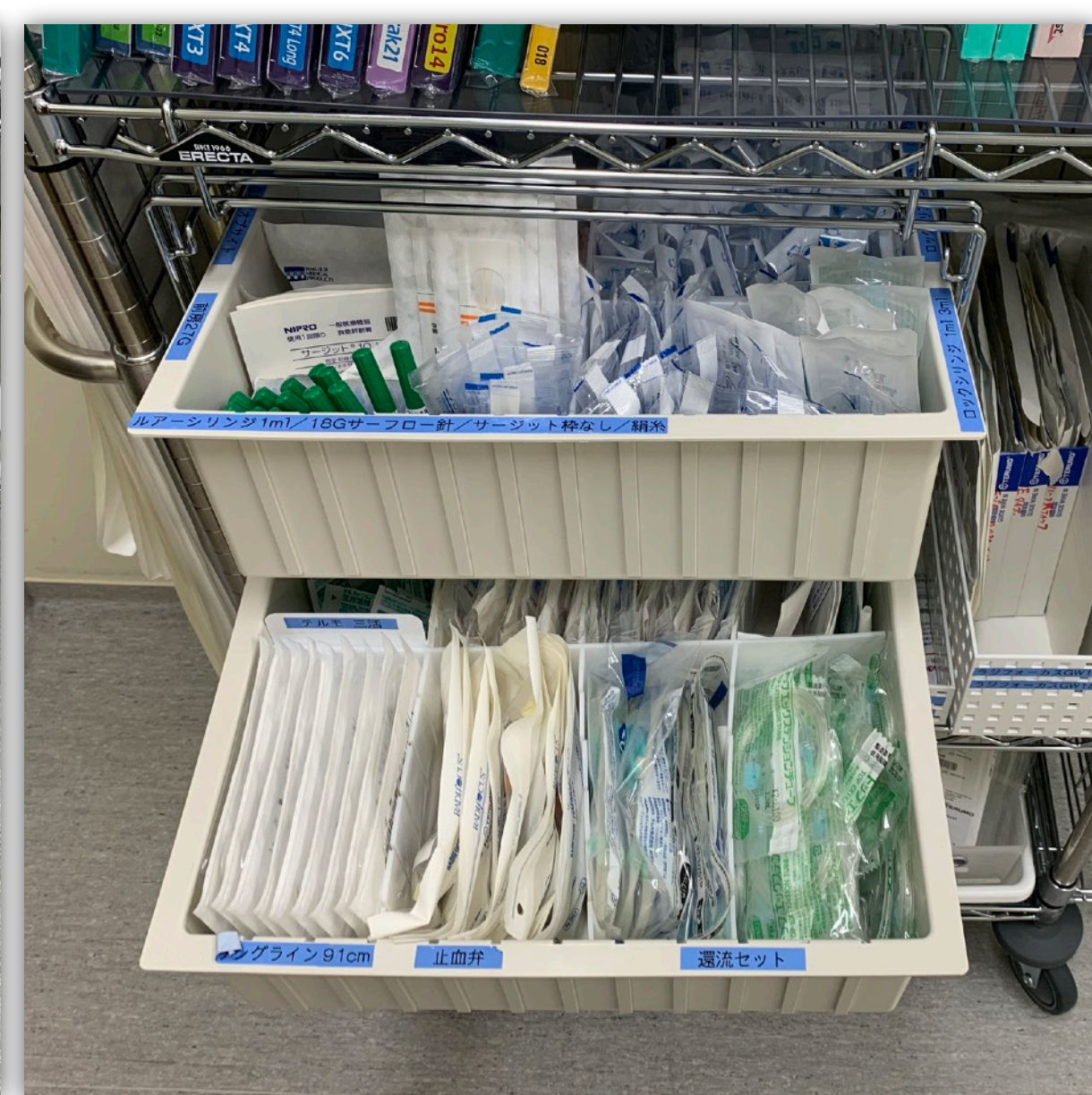
引き出しにYコネ、シリンジなど